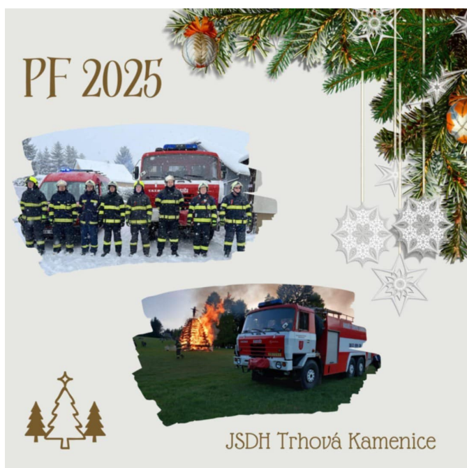
JSDH Trhová Kamenice

Všem občanům přejeme, nejen aby se s naší jednotkou v roce 2025 setkávali pouze při pořádání různých kulturních, společenských a sportovních akcích, ale přejeme vám všem hlavně pevné zdraví, šťastný a pohodový rok.